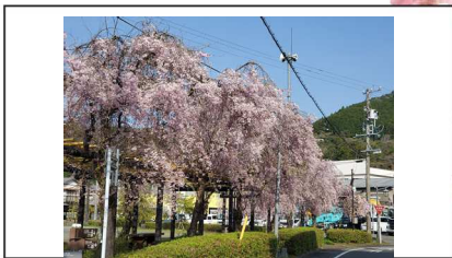
野守の池 / 散りはじめ