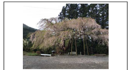
寿永の桜 / 終わり