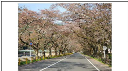
緑地公園 / 落下さかん(1/3残)