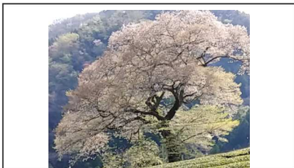
みずめ桜 / 落下さかん(1/3残)