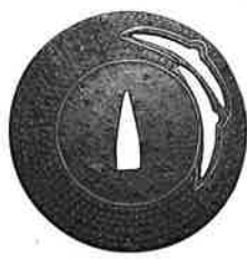
無銘 心仁 室町時代 個人蔵