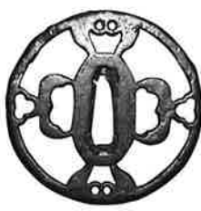
無銘 金山 室町時代 個人蔵